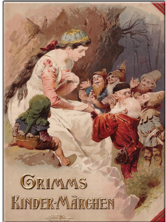
“Kinder-Märchen” Gesammelt von den Brüdern Grimm Stuttgart, Loewes Verlag, Ferdinand Karl. ca. 1893 Illustration: R. Zick u.a. Cover

die ersten fünf Staffeln unserer Serie “Petites Images” (kleine Bilder) ist mit den Blättern 1.1 bis 1.20, 2.1 bis 2.20, 3.1 bis 3.20, 4.1 bis 4.20 und 5.1 - 5.20 beendet. Ein neuer Zyklus ist jetzt da! Als 6.1 bis 6.,20 wird es wieder jeden Dienstag je 2 mal 4 Bilder geben. Neue Bilder, die jeweils ziemlich unbekannt sind. Die endlich wieder – das ist unser Anspruch – aus dem Dunkel des Vergessens hinauf gehoben werden sollen. Zwei Künstler waren freilich schon im vorherigen Zyklus anwesend. Sie sind so gut, dass wir sie auch in der 6. Staffel weiter leben lassen wollen. Wieder wird Ferdinand Hendl aus Wien die Bilder für das Netz bearbeiten. Dafür gilt ihm – wie immer – unser grosser Dank! Bis heute sind 100 Blätter mit 400 Illustrationen in unserem kleinen (petit) Bauchladen erschienen. Jetzt also auf zu den nächsten 100 Bildern!