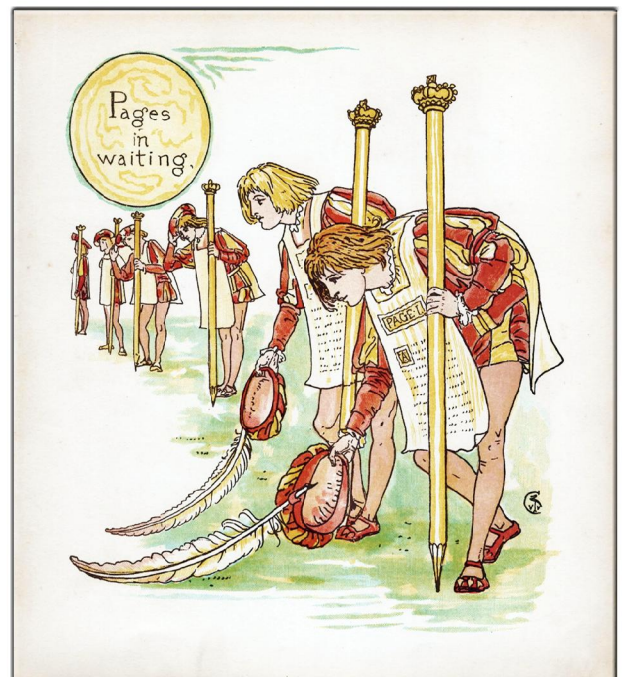
“Little Queen Anne” 1886 London, Verlag , Marcus Ward & Co Limd, Illustrationen von Walter Crane, Bild 8.