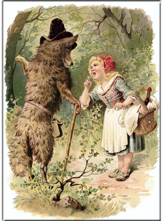
"Kinder-Märchen" Gesammelt von den Brüdern Grimm Stuttgart, Loewes Verlag, Ferdinand Karl, ca. 1893 Illustration: R. Zick u.a.1. Farbiges Innenblatt

die ersten fünf Staffeln unserer Serie "Petites Images" (kleine Bilder) ist mit den Blättern 1.1 bis 1.20, 2.1 bis 2.20, 3.1 bis 3.20, 4.1 bis 4.20 und 5.1 - 5.20 beendet. Ein neuer Zyklus ist jetzt da! Als 6.1 bis 6.,20 wird es wieder jeden Dienstag je 2 mal 4 Bilder geben. Neue Bilder, die jeweils ziemlich unbekannt sind. Die endlich wieder – das ist unser Anspruch – aus dem Dunkel des Vergessens hinauf gehoben werden sollen. Zwei Künstler waren freilich schon im vorherigen Zyklus anwesend. Sie sind so gut, dass wir sie auch in der 6. Staffel weiter leben lassen wollen. Wieder wird Ferdinand Hendl aus Wien die Bilder für das Netz bearbeiten. Dafür gilt ihm – wie immer – unser grosser Dank! Bis heute sind 100 Blätter mit 400 Illustrationen in unserem kleinen (petit) Bauchladen erschienen. Jetzt also auf zu den nächsten 100 Bildern!