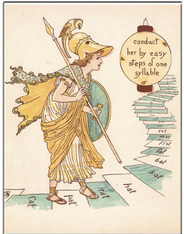
"Little Queen Anne" 1886 London, Verlag , Marcus Ward & Co Limd, Illustrationen von Walter Crane, Bild 9.