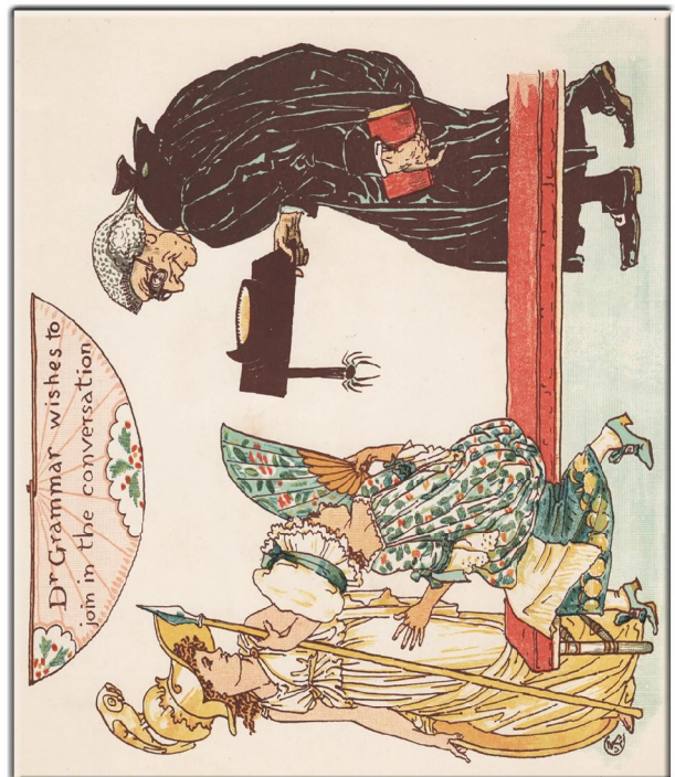
"Little Queen Anne" 1886 London, Verlag, Marcus Ward & Co Limd, Illustrationen von Walter Crane, Bild 17