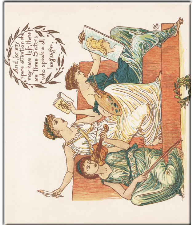
"Little Queen Anne" 1886 London, Verlag, Marcus Ward & Co Ltd., Illustrationen von Walter Crane, Bild 19