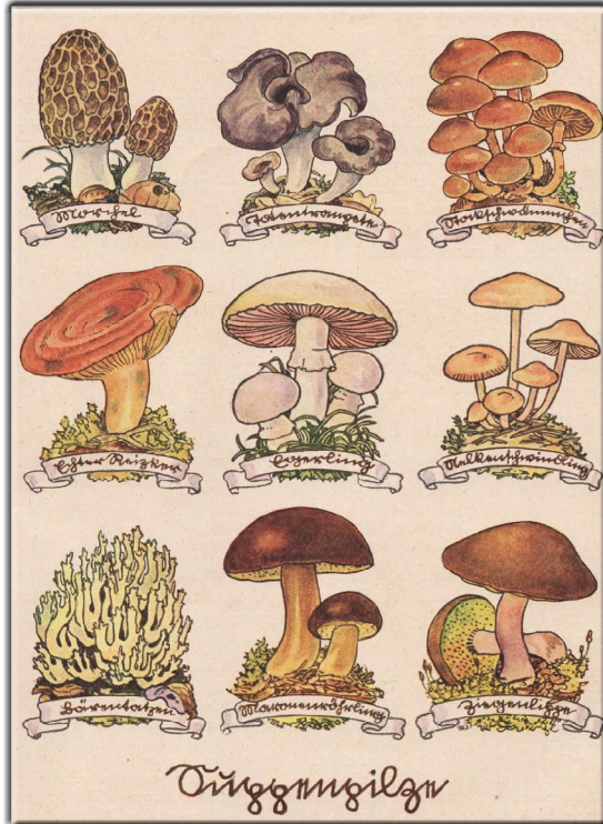
"Hannerl in der Pilzstadt": Text von Annelise Umlauf-Lamatsch, Illustrationen von Hans Lang, Deutscher Verlag für Jugend und Volk, Wien 1941, Seite 20