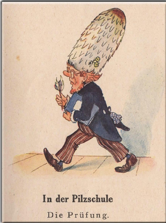
In der Pilzschule Die Prüfung.