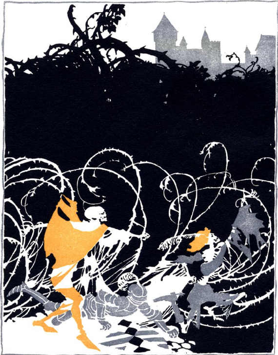
C. S. Evans: The Sleeping Beauty, Bilder von Arthur Rackham, Verlag: William Heinemann, London, 1934 S.4