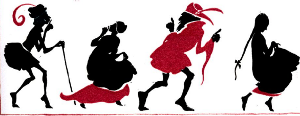
C. S. Evans: The Sleeping Beauty, Bilder von Arthur Rackham, Verlag: William Heinemann, London, 1934 S.3