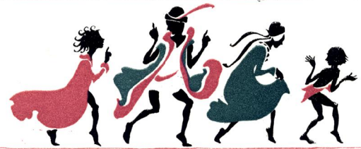
C. S. Evans: The Sleeping Beauty, Bilder von Arthur Rackham, Verlag: William Heinemann, London, 1934 S.2