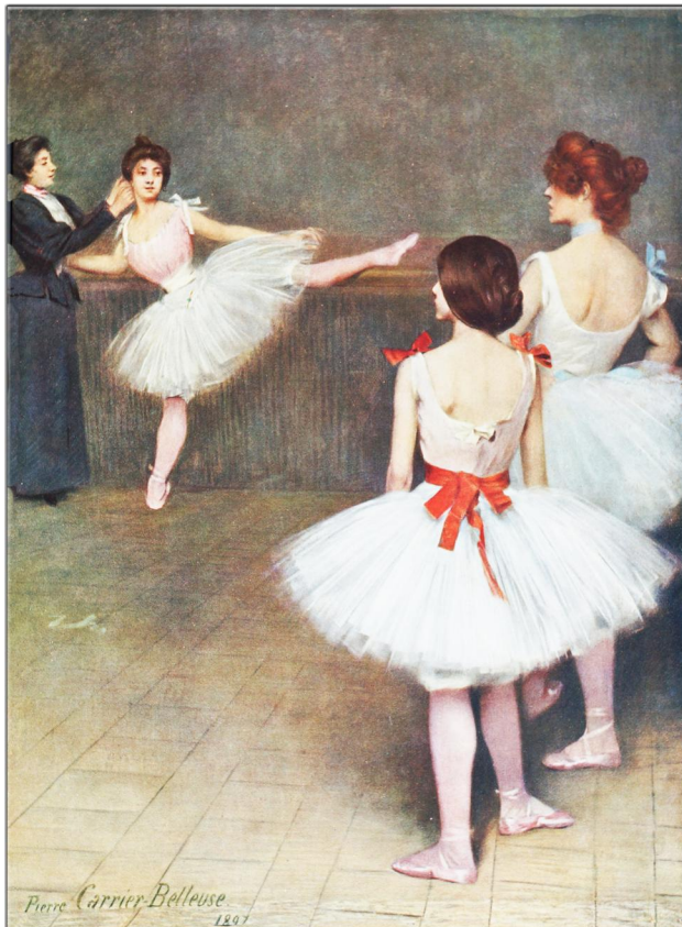
„Meister der Farbe“ 1904 Künstler: Pierre Carrier-Belleuse Name des Bildes: Die Tanzklasse der Pariser Oper