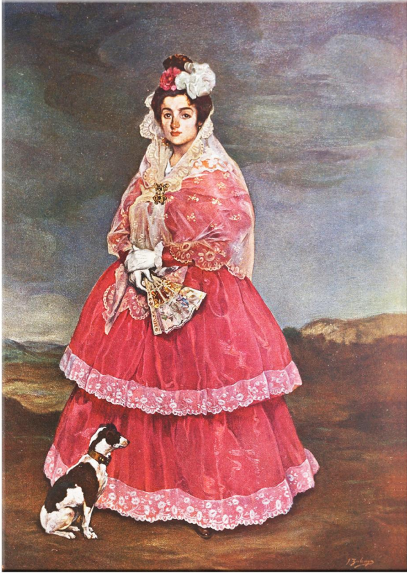
„Meister der Farbe“ 1904 Künstler: Ignacio Zuloaga Name des Bildes: CONSUELO