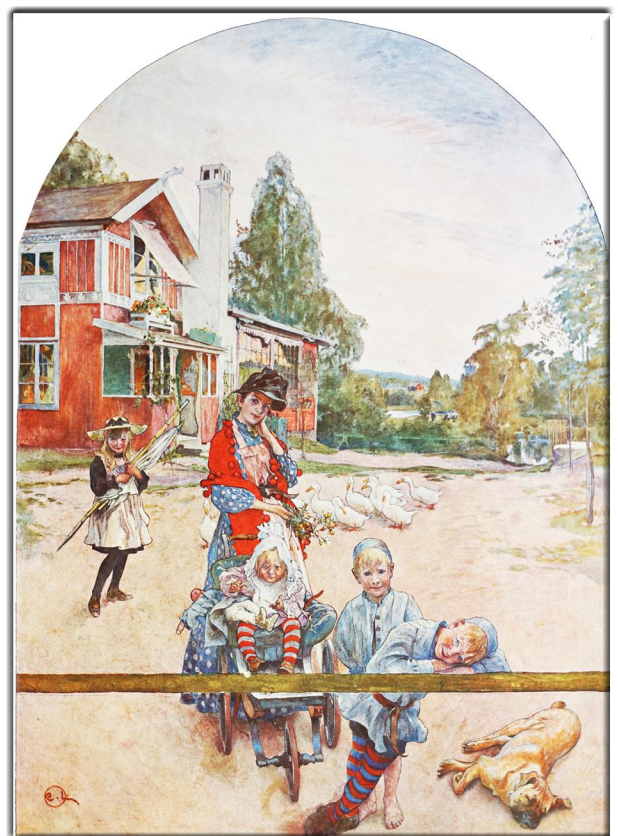
„Meister der Farbe“ 1904 Künstler: Karl Larsson Name des Bildes: Die Meinen