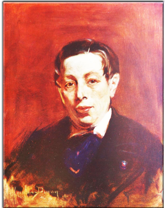
“Meister der Farbe” 1904 Künstler: Carolus Duran Name des Bildes: Porträt des Herrn Albert Wolff