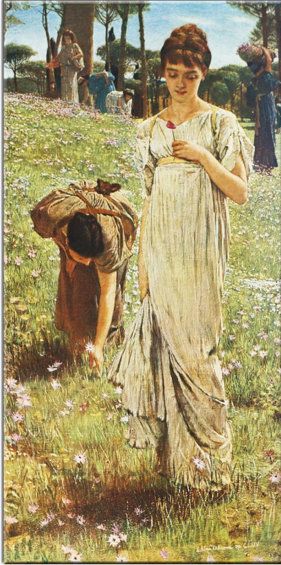
“Meister der Farbe” 1904 Künstler: Sir Lawrence Alma-Tadema Name des Bildes: Frühling